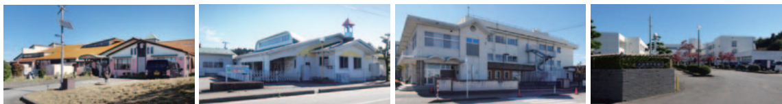
大久保認定こども園/約2.0~2.1km 大沢野こども園/約1.7~1.8km 大久保小学校/約1.2~1.3km 大沢野中学校/約1.9~2.0km