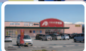
クスリのアオキ黒部中央店 ／約930～1,180m