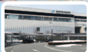
北陸新幹線黒部宇奈月駅 ／約3.8～4.1km