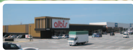
アルビス、ナフコ／団地近接