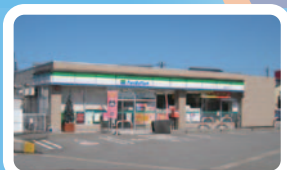
ファミリーマート黒部市前沢店 ／約270～520m